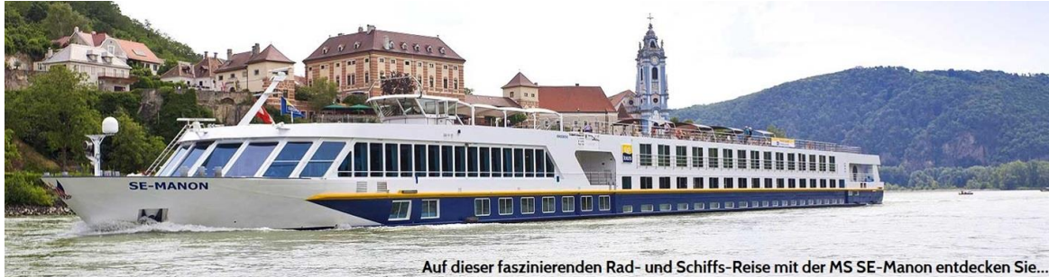
Auf dieser faszinierenden Rad- und Schiffs-Reise mit der MS SE-Manon entdecken Sie...