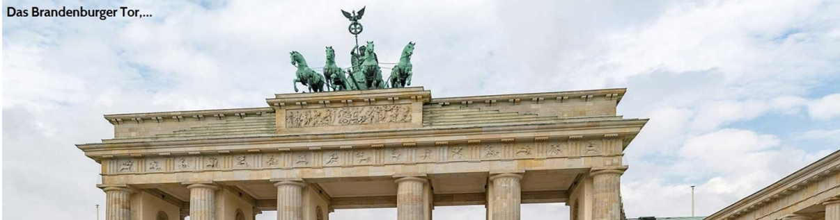
Das Brandenburger Tor,...