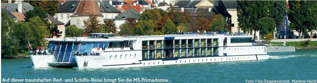
Auf dieser traumhaften Rad- und Schiffs-Reise bringt Sie die MS Primadonna...