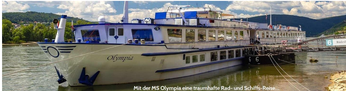
Mit der MS Olympia eine traumhafte Rad- und Schiffs-Reise...