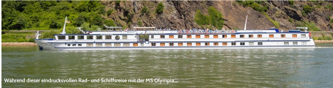
Während dieser eindrucksvollen Rad- und Schiffsreise mit der MS Olympia...